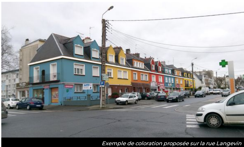
Exemple de coloration proposée sur la rue Langevin