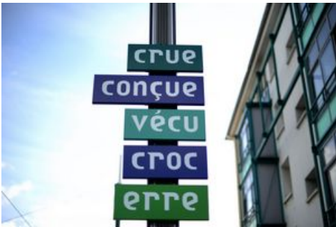
Le générateur de Recouvrance