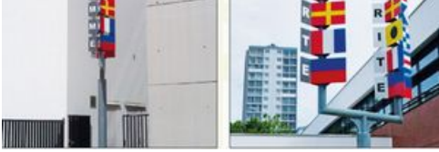
L'arbre à palabres et pavois