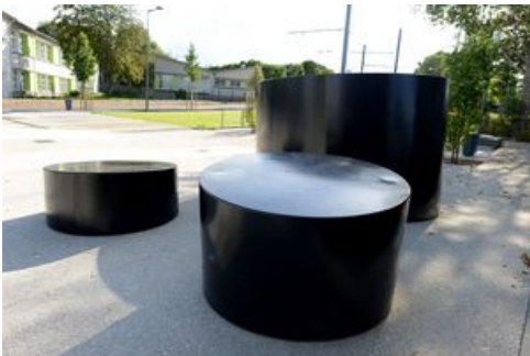
Les cylindres vibrants