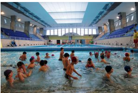
La piscine Foch