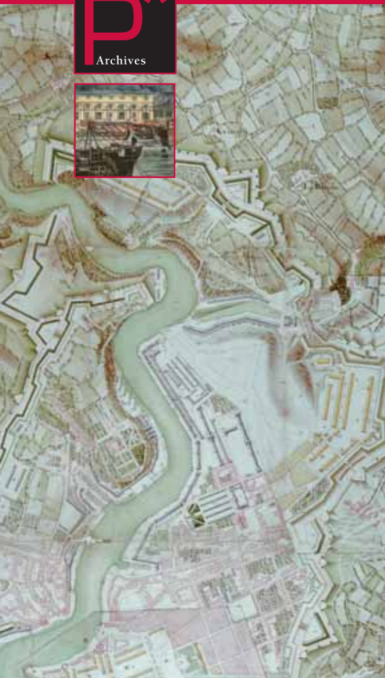
Plan Desandrouin, 1790