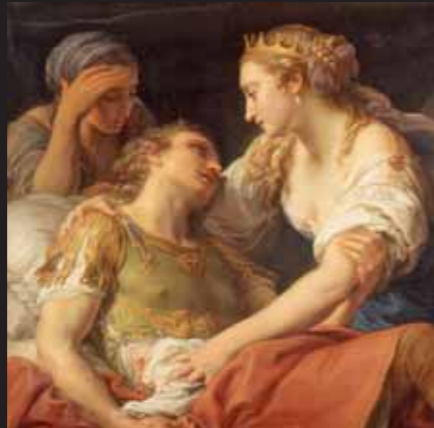
BATONI Pompéo - La mort de Marc-Antoine , 1763 - n° 966.181.1

Cette mise en ligne doit respecter les droits des artistes, quand les œuvres ne sont pas encore dans le domaine public, les droits des photographes et des institutions. La photogra-