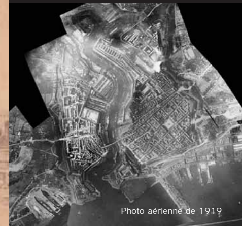
Photo aérienne de 1919