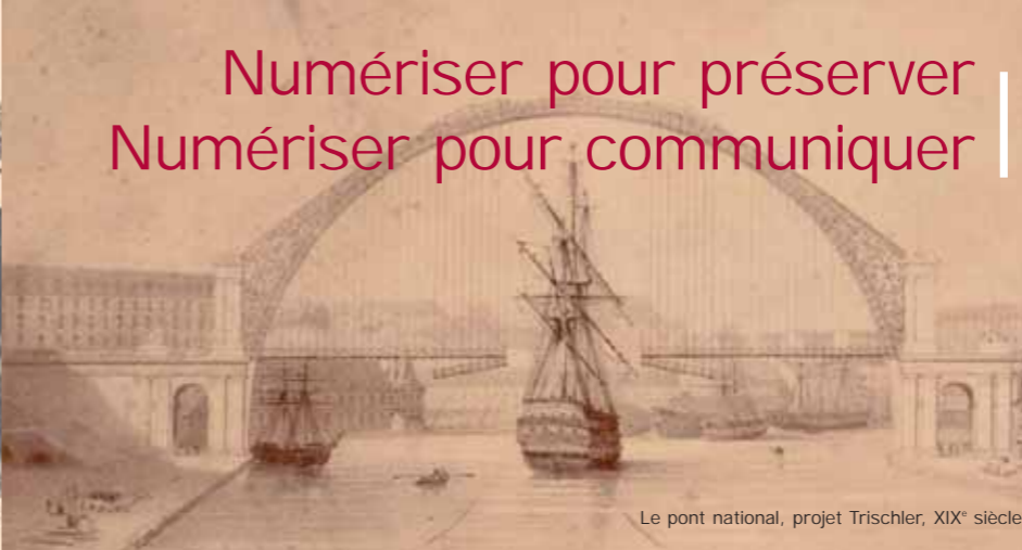
Le pont national, projet Trischler, XIX e siècle