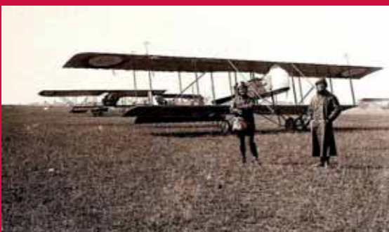
Fête de l'Aviation, Brest, 1912