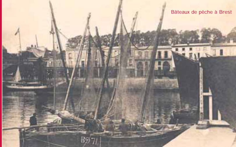
Bâteaux de pêche à Brest