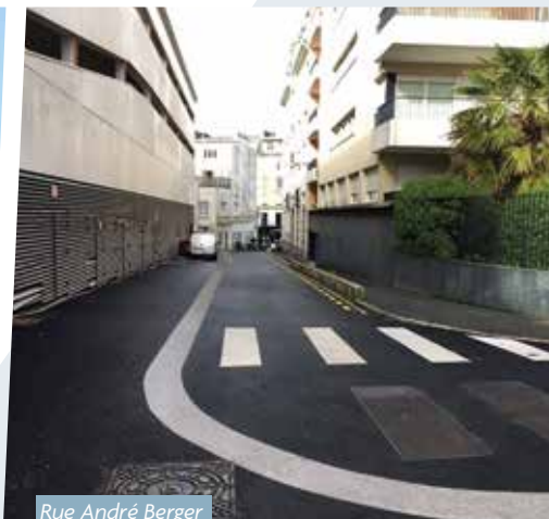
Rue André Berger