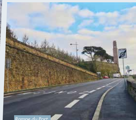
Rampe du Port