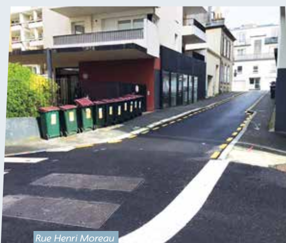
Rue Henri Moreau