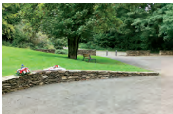
Jardin de la Brasserie