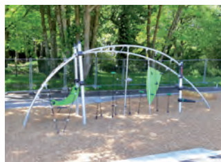
Jardin de Kéravelloc