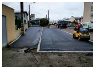
Rue de Kermaria

(*) Rue de Kermaria et rue du Calvaire : aménagements de sécurité et revêtement de chaussée pour un coût de 415 936 € TTC.