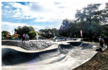
Skate Park Jardin Kennedy