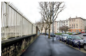
Porte de la Corderie