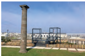
Square de Bazeilles