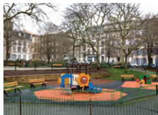
Jeux Place Sanquer