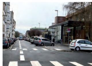
Rue Félix Le Dantec