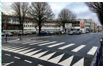
Sécurisation école publique Simone Veil