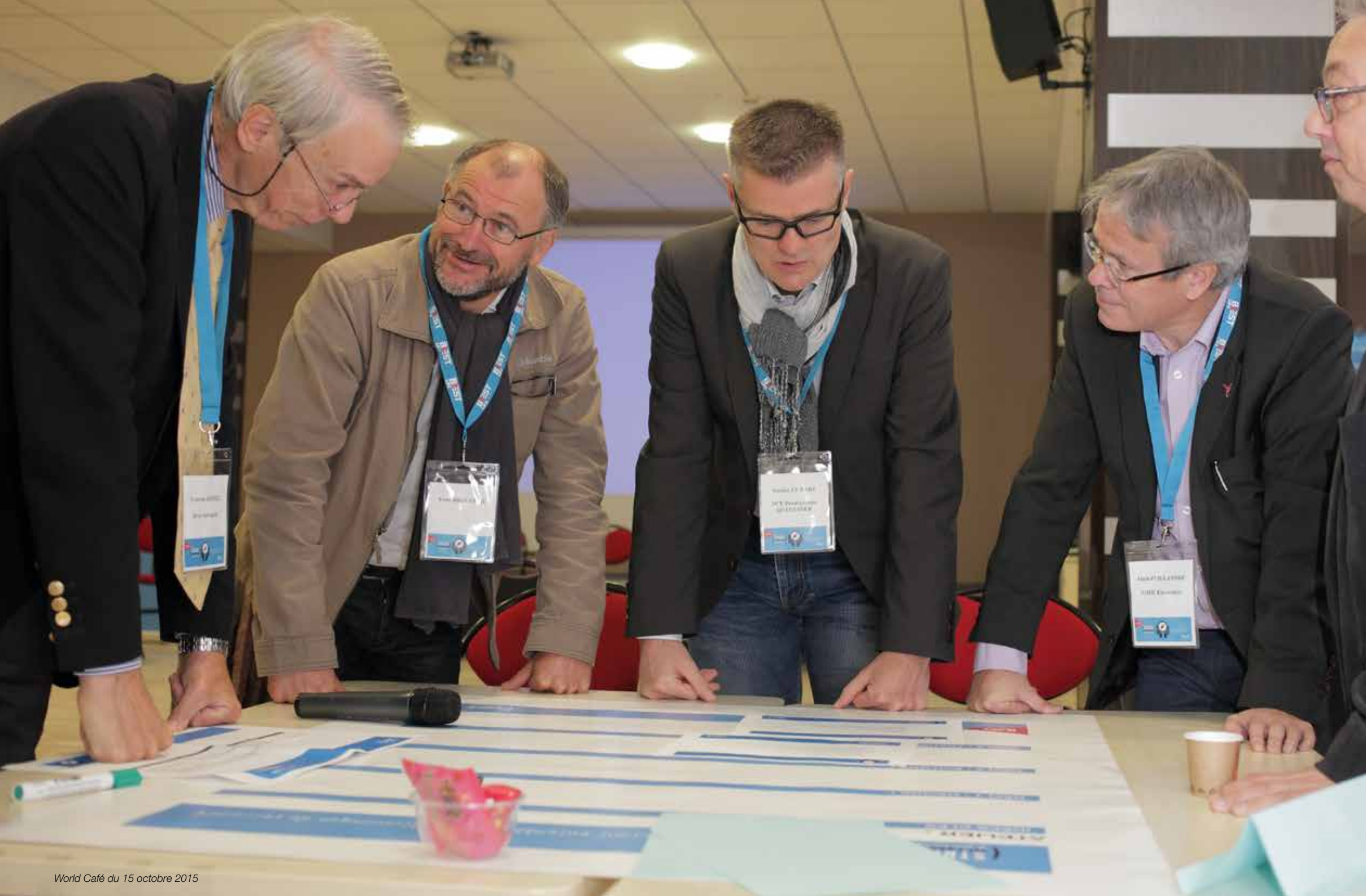
World Café du 15 octobre 2015