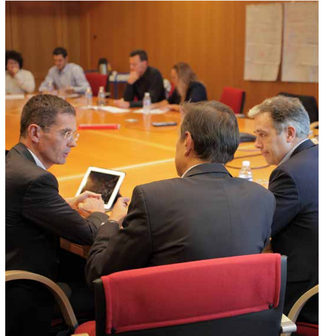
Les membres du Brest Business Life, en séance de travail