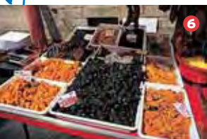
Marché de Saint-Renan (tous les samedis matin)