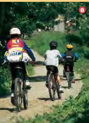
Environs de Kersquivit

M ont a reer gant an hent a gammigelloù en ur vro c'hlas enni koadoù ha pradeier.