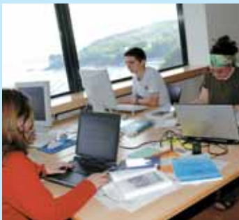
» former pour l'avenir