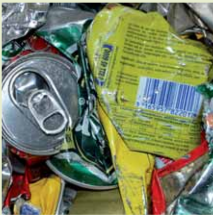
» traquer les emballages