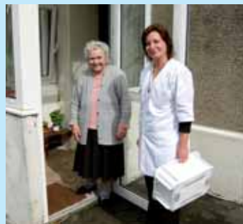
» répondre présent