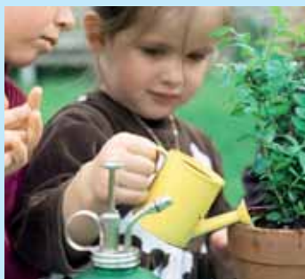
» récupérer l'eau de pluie