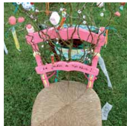
» redonner vie