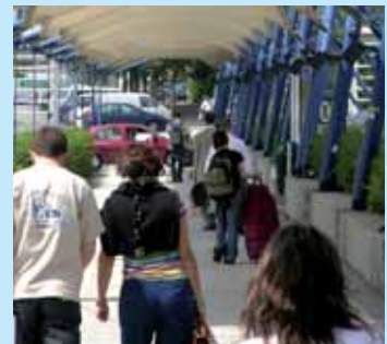
» privilégier les transports collectifs