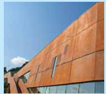
» imaginer la ville