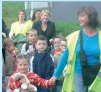
» se déplacer autrement