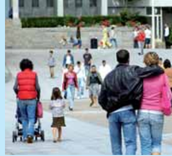
» partager l'espace