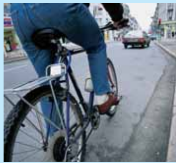
» bouger c'est la santé