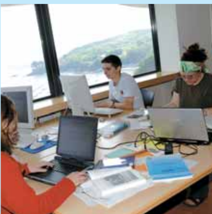
» former pour l'avenir