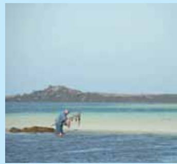
» sauvegarder les ressources