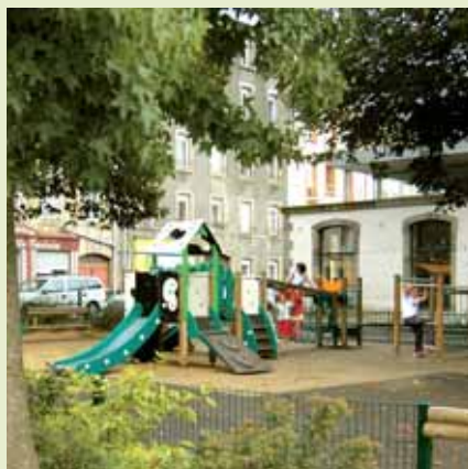
» aménager pour chacun