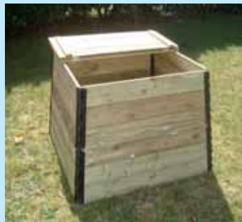
» recycler les déchets