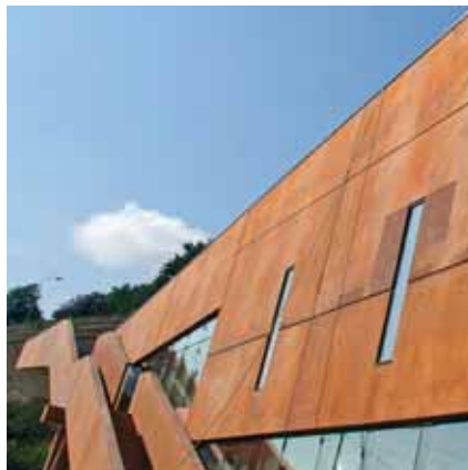
» imaginer la ville