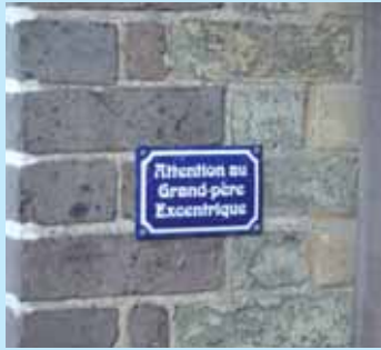
» vivre la différence