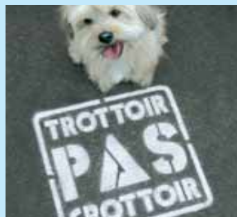
» respecter le territoire