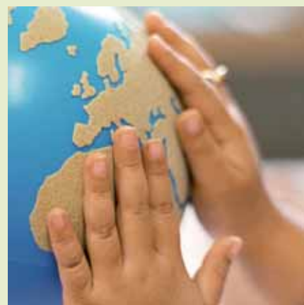
» préparer demain