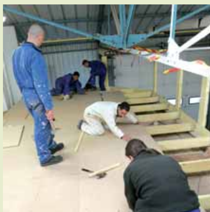
» travailler ensemble

Prochainement à Gouesnou, la mise en place de repas bio dans les cantines de la commune ou la création du futur terrain de football tiendront ainsi compte des préconisations du Développement Durable.