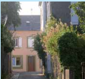
» apprécier son quartier