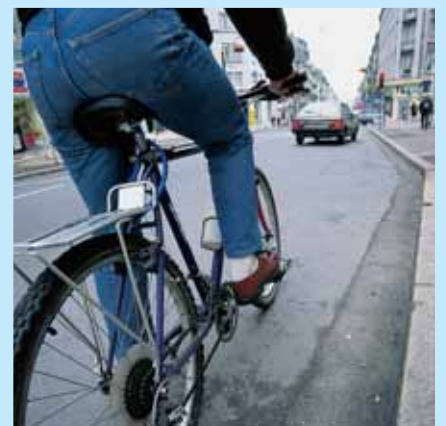
» bouger c'est la santé