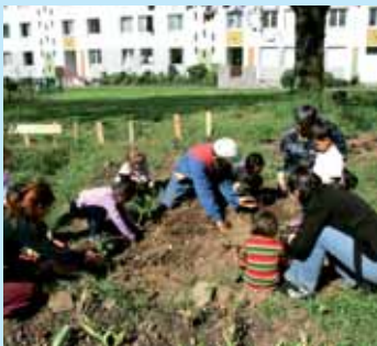
» cultiver son jardin