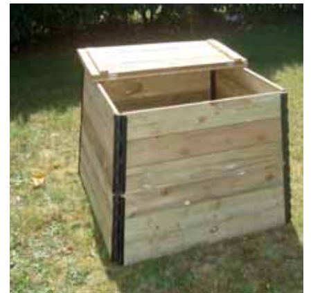
» recycler les déchets