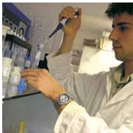
» encourager la recherche