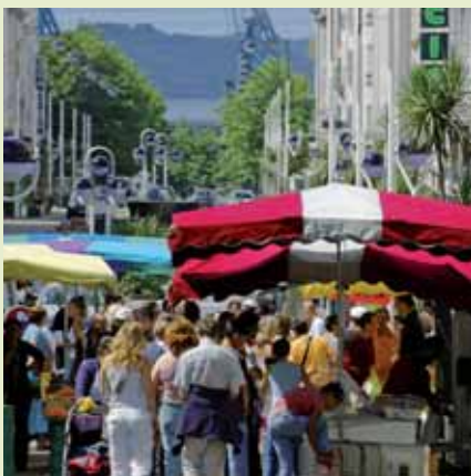
» consommer intelligemment