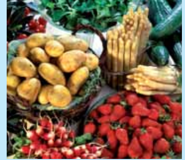
» cuisiner sain