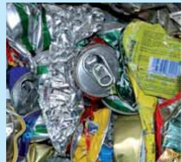
» traquer les emballages