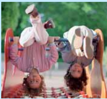
» rester simple