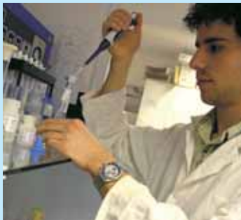
» encourager la recherche