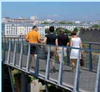
» respirer à pleins poumons