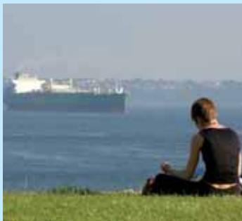
» apprécier l'instant