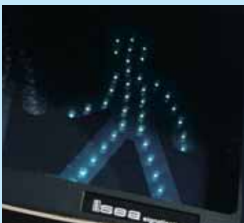
» écouter son corps