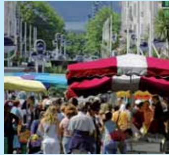
» consommer intelligemment