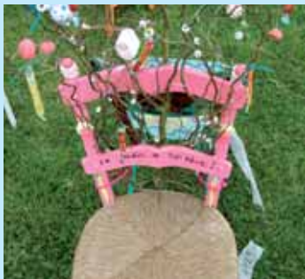
» redonner vie

Ce document est édité. Sur papier recyclé. N'oublions pas que plus de la moitié des lecteurs n'ont pas professionnellement accès à Internet. Les prendre en compte avec cette édition papier est une valeur écocitoyenne !