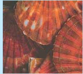
» préserver la rade