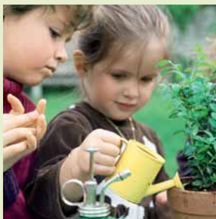
» récupérer l'eau de pluie