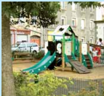
» aménager pour chacun