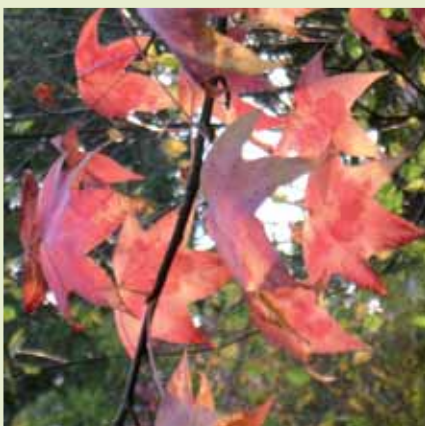
» vivre avec les saisons