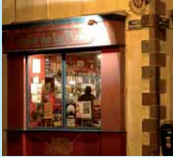
» économiser la lumière