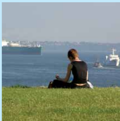
» apprécier l'instant

Pour éviter l'écueil qui ferait du Développement Durable une simple affaire de "cadres", les agents des deux collectivités ont très tôt été sollicités pour participer à un groupe technique chargé de plancher sur les meilleures façons de faire se combiner les principaux piliers du Développement Durable (environnement, économie, social) avec les actions menées au sein des services. Organisée autour de quatre orientations fortes (Consommer et produire responsable ; Concilier les temps de la ville avec ceux de la vie ; Conforter la qualité du cadre de vie sur le territoire ; Échanger avec le monde, du local à l'international), une quarantaine de fiches-actions a émergé et servira bientôt de charpente au futur Agenda 21 interne de la collectivité.