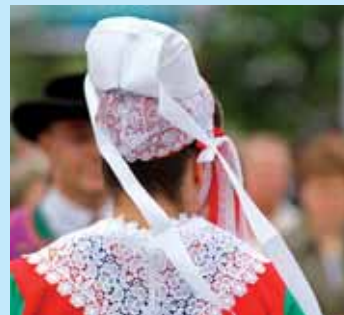
» mêler les cultures