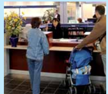
» être à l'écoute