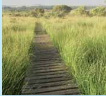
» garder le naturel