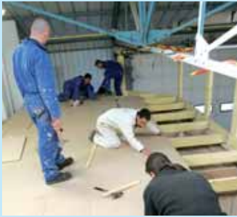
» travailler ensemble