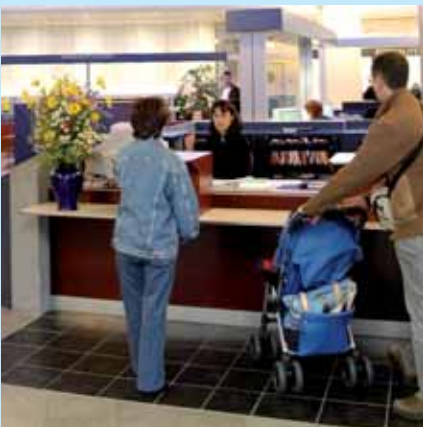
» être à l'écoute