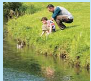
» unir les générations