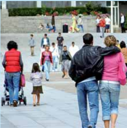
» partager l'espace