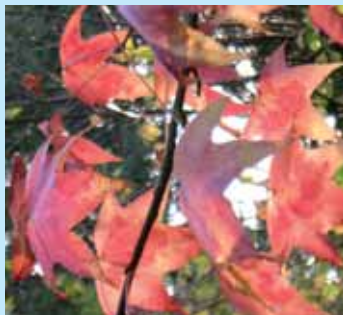
» vivre avec les saisons