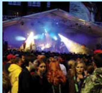
» prendre le temps de vivre